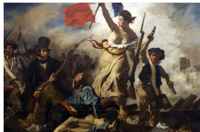
Eugène DELACROIX : La liberté guidant le peuple (Tableau réalisé en 1830, inspiré de la révolution des Trois Glorieuses (1830). Présenté au public au Salon de Paris de 1831 sous le titre Scènes de barricades ). L'allégorie de la Liberté, c'est une fille du peuple , vivante et fougueuse, qui incarne à la fois la révolte et la victoire. Le drapeau tricolore, au centre du tableau associé à la liberté , ici, symbole de la libération du peuple du joug de son oppresseur, est dans le prolongement de son bras droit, ne faisant qu'un avec lui. Il se déploie de manière ondulatoire et virile vers l'arrière, bleu, blanc, rouge. Du sombre au lumineux, comme une flamme...

« La France et le drapeau tricolore, c'est une même pensée, un même prestige, une même terreur au besoin pour nos ennemis. »