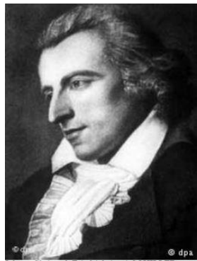
Johann Christoph Friedrich (von) SCHILLER

Au 18 ème siècle, est-il besoin de le rappeler, se développe l'esprit des lumières. L'on rêve à une société plus égalitaire fondée sur la Raison, la liberté, la fraternité humaine, le progrès de la connaissance.